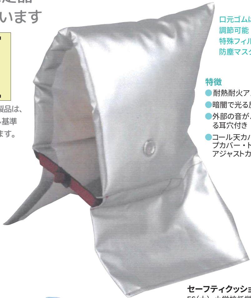
セーフティクッション (ES) ES(大) 小学校低学年以上