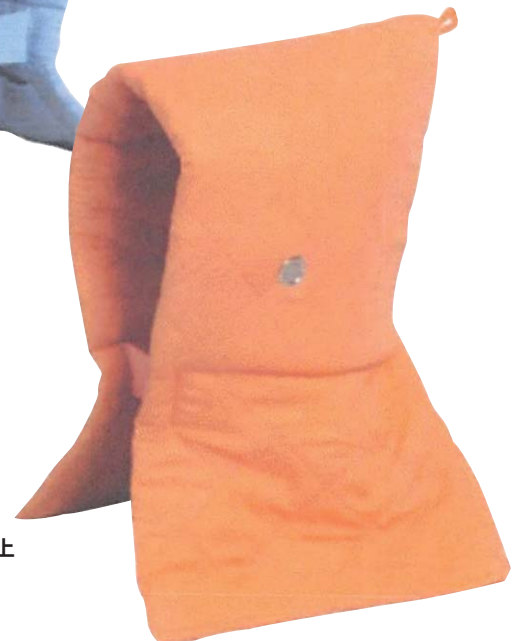
K タイプずきん 小学校低学年以上 ブルー / オレンジ