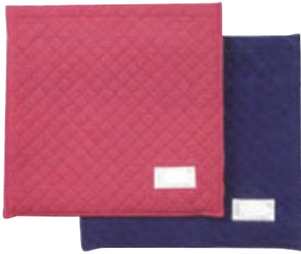
コール天カバー (大 / ブルー)